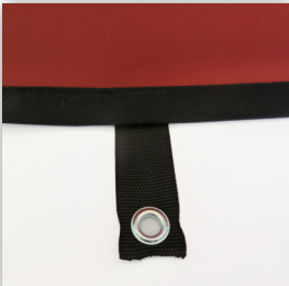
Ösen für die Befestigungsdübel