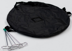
Bodendübel und Nylontasche

4 Bodendübel zur Befestigung schwarze Transporttasche aus Nylon