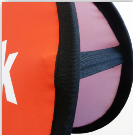
Verstärkung durch Klettbänder